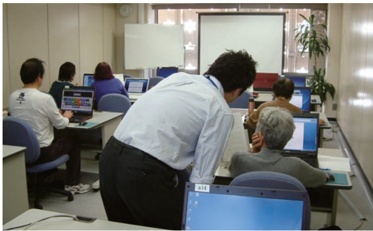
自分のペースで習いたい講座を自由に